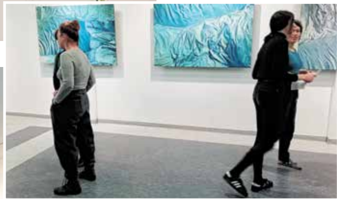
Galerija Akademije mjesto je gdje redovito izlažu umjetnici