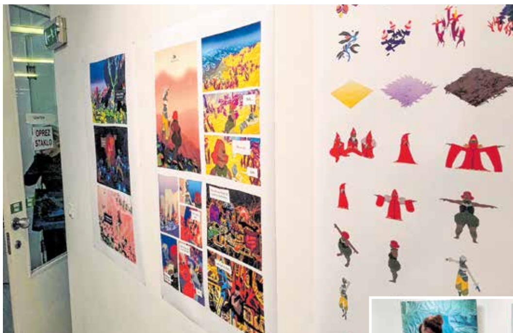
Izložba Alumni APURI predstavila je petero umjetnika