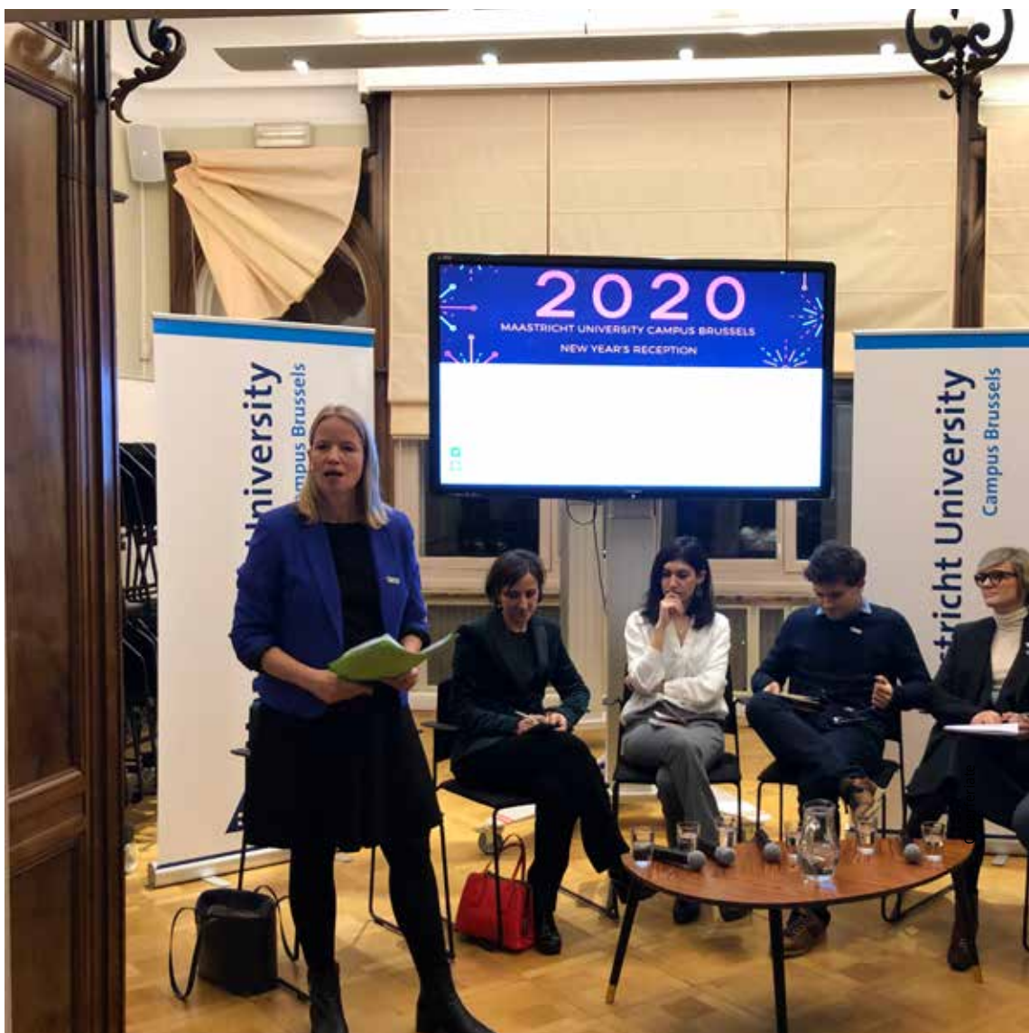
Rasprava je održana u Kampusu Sveučilišta u Maastrichtu povodom početka nove godine

Postoji snažna korelacija između stanja sloboda i demokracije te stupnja inovacija i znanstvene produkcije