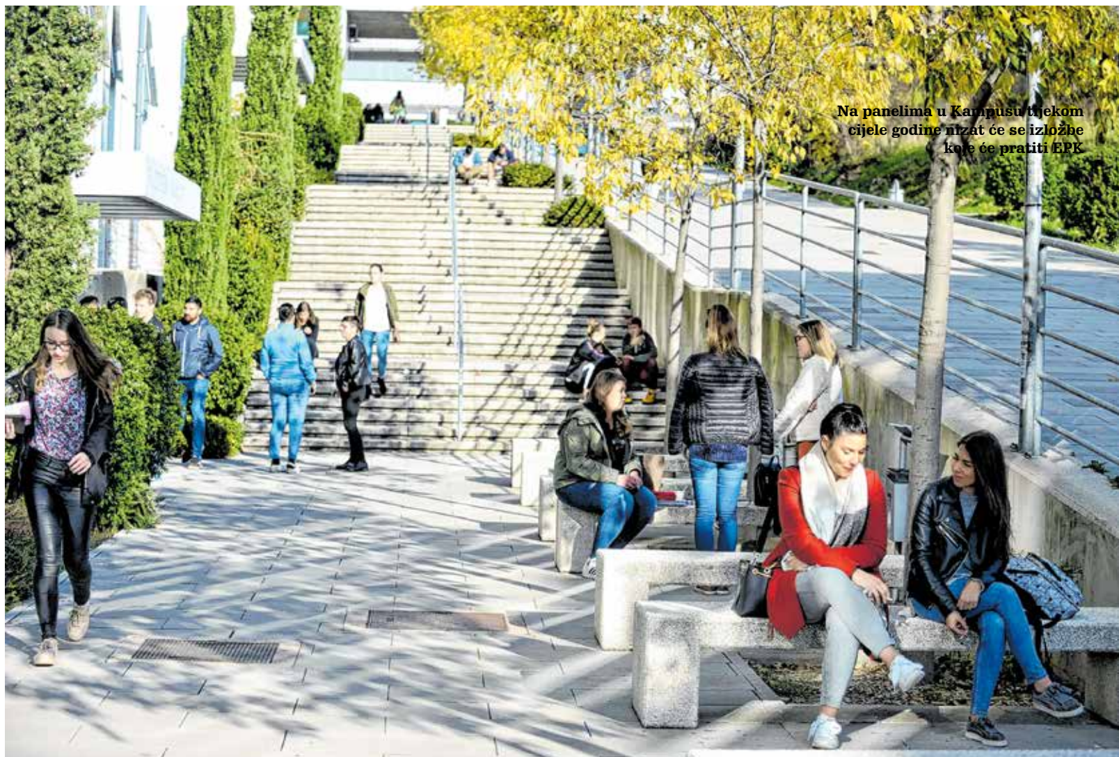
Na panelima u Kampusu tijekom cijele godine nizat će se izložbe koje će pratiti EPK

*Mornarička akademija – knjiga, Ana Alebić Juretić